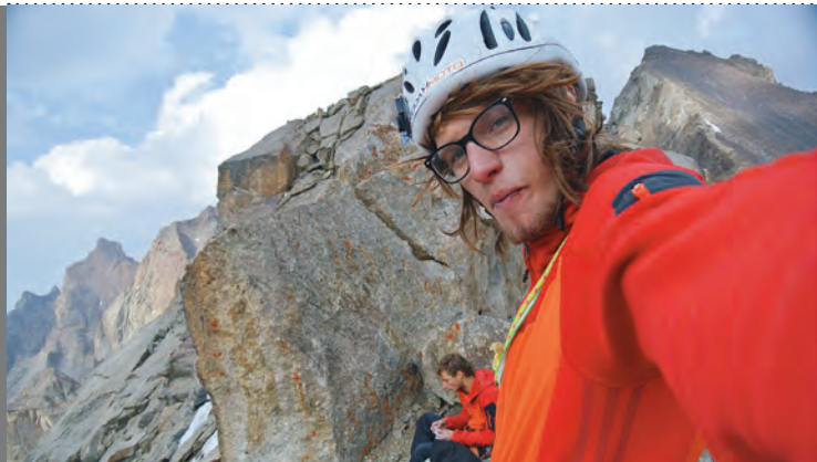
AKSU, Kirzighistan